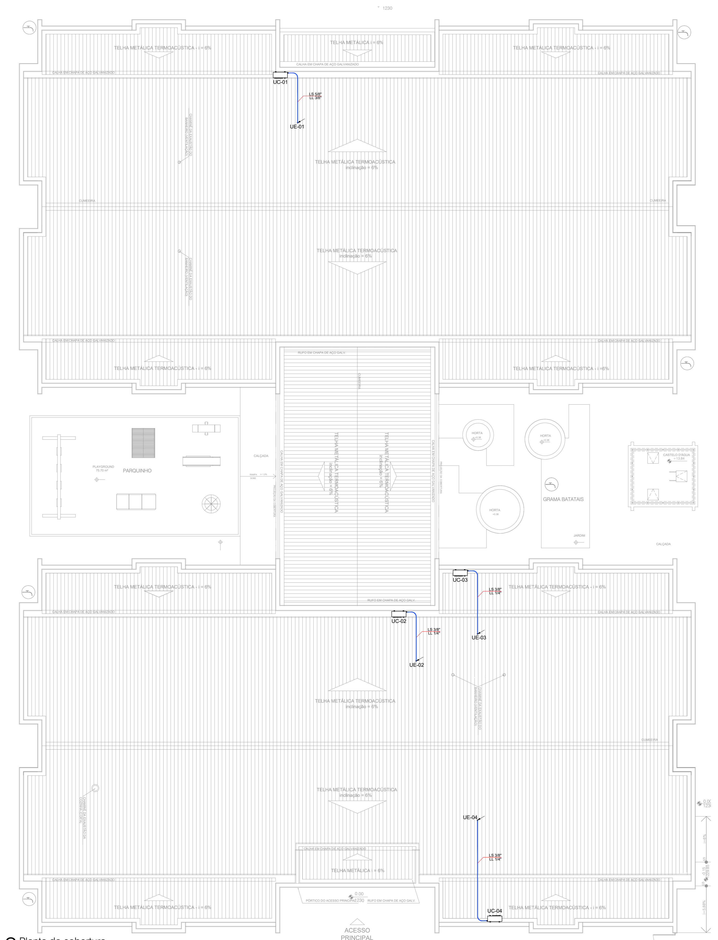
2 Planta da cobertura ESC. 1/100