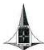
TABELA DE REFERÊNCIA: SIMPLI - SETEMBRO DE 2013 SEM DESONERIZAÇÃO