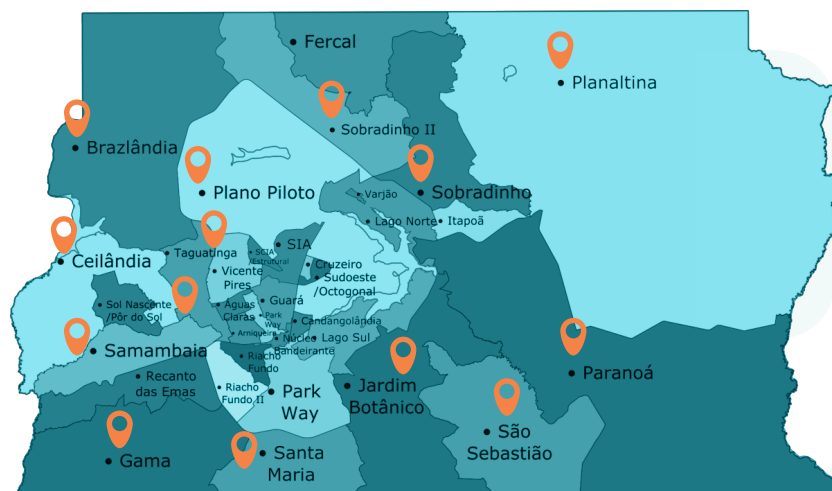
Figura. Território do Distrito Federal

A Rede Pública de Ensino do Distrito Federal conta atualmente com aproximadamente 800 unidades escolares, 470.000 estudantes e 46.835 profissionais da educação.