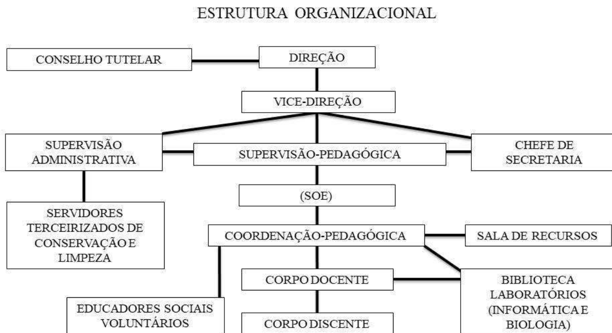
Figura – 01. Estrutura Organizacional

BIBLIOTECA: Com a finalidade de também ser um espaço para a aprendizagem e construção de conhecimento, a biblioteca do CED Stella - “Saberoteca Renato Russo” - disponibiliza por meio de sua estrutura e acervo de livros, o suporte à aprendizagem permanente do estudante e apoio aos docentes para a realização das atividades pedagógicas. Com a principal finalidade de desenvolver a competência da leitura, a biblioteca tem desempenhado um papel de suporte aos professores e estudantes no contexto das atividades remotas com a produção de vídeos informativos e tem feito o uso da tecnologia para a difusão de informações seguras e incentivar o desenvolvimento da leitura em casa.