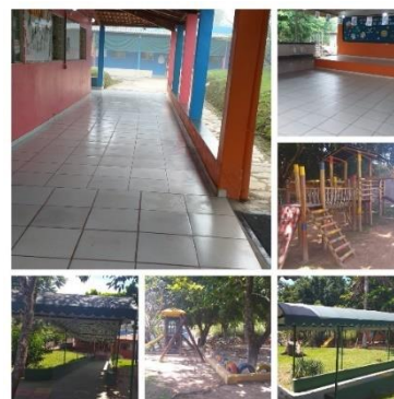
Escola nos dias atuais