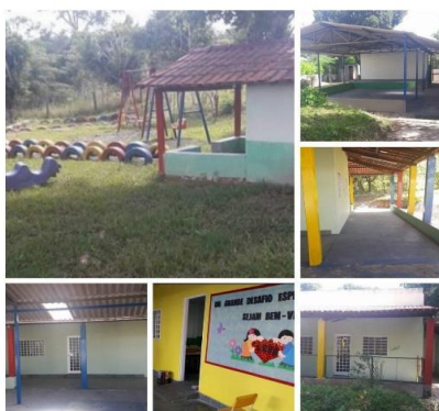
Escola na inauguração