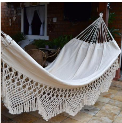
Rede de descanso com macramê