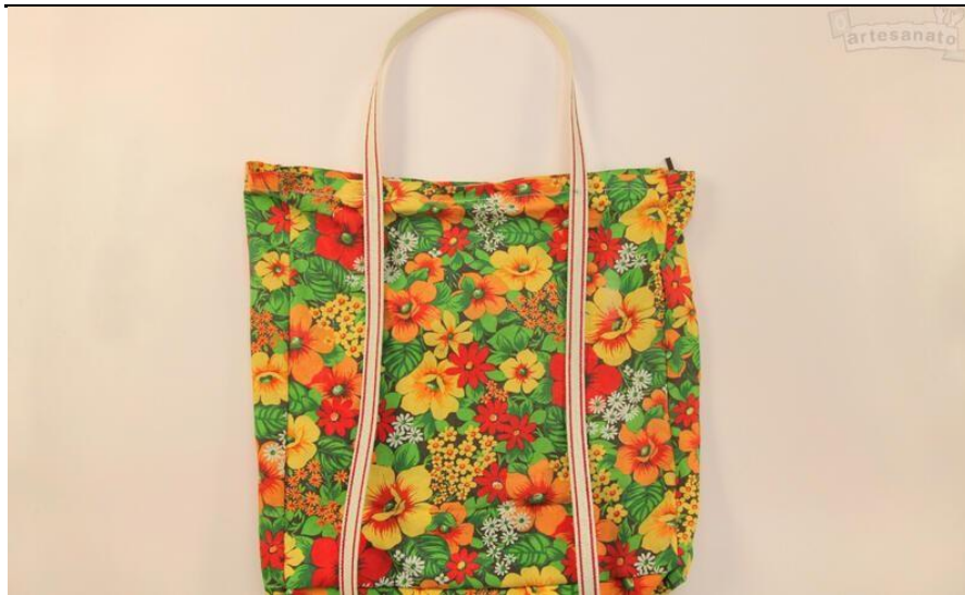
Bolsa de tecido