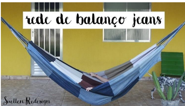
Rede de descanso com jeans