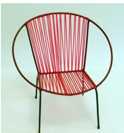
Cadeira de ferro com fio espaguete