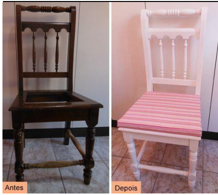
Renovação de Móvel de madeira