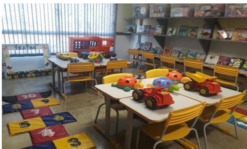
Brinquedoteca/Sala de leitura