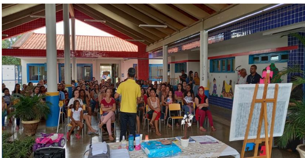
1ª Reunião de pais

salientamos ainda a importância da participação dos responsáveis no conselho de classe e aproveitamos para falarmos da organização curricular da creche, como os projetos interdisciplinares. Houve um momento para que a comunidade escolar pudesse sanar as suas dúvidas e anseios e teve acesso a um questionário com três perguntas onde os mesmos relataram sua contribuição para o PPP. A comunidade participou ativamente demonstrando carinho e afeto pela instituição. Ao término da reunião foi informado a comunidade escolar que o PPP da Cepi Juriti se encontrará na instituição e no site da Secretaria da Educação e que traduz os princípios, as diretrizes de decisões pedagógicas aprovadas e assumidas pela instituição de ensino, envolvendo o corpo docente, pais, técnico e administrativo da escola, que após análises, reflexões e discussões sobre a legislação educacional vigente e em consonância com a expectativa e necessidades de seus usuários, elaboraram-na. A instituição educacional apresenta na sua Proposta Pedagógica os objetivos e metas que se pretende conquistar para garantir educação de qualidade, envolvendo os professores, alunos e comunidade no processo de ensino-aprendizagem contribuindo para o desenvolvimento integral do educando. Nesse sentido, informamos que esta proposta se trata apenas de um “desenho”, um “esboço”, daquilo que pretendemos realizar no tempo e no espaço por nós vividos no INSTITUTO MÃOS SOLIDÁRIAS - CEPI JURITI.