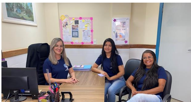
Diretora, secretária e coordenadora