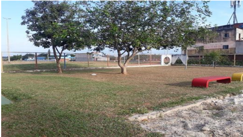
Área verde e parque de areia