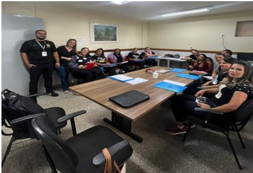
Coordenação pedagógica com os Docentes

➤ Executar outras atividades compativeis com sua função, sempre que se fizer necessário.