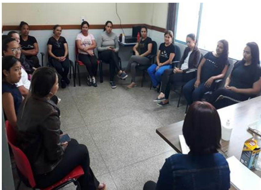
Formação/coordenação com as Monitoras