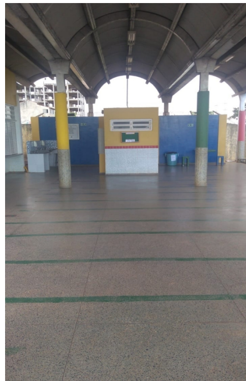
Pátio de Acolhida