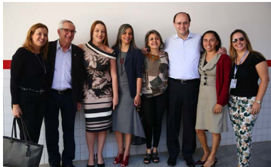
Autoridades federais e distritais na inauguração do CEPAG

a estudantes do Guará, porém, foi expandida às demais regiões administrativas, e o CEPAG já possui matrículas de estudantes de outras dez regionais de ensino: Plano Piloto, Recanto das Emas, Núcleo Bandeirante, Ceilândia, Taguatinga, Samambaia, Brazlândia, Paranoá, Santa Maria e Gama.