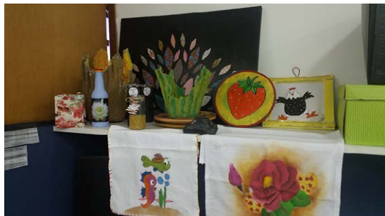
Trabalhos de estudantes confeccionados no curso de Artesanato.

Os cursos têm carga horária de 160h e são realizados em parceria com o Programa