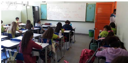
OBMEP no CEF 306 Norte

A OBMEP já está estabelecida como uma das principais e mais abrangentes olimpíadas do Brasil; foram milhões de jovens por todo o território nacional envolvidos com as questões da prova no dia 05 de junho. Já a OMDF começa a se afirmar como a olimpíada de matemática mais significativa do DF, e já cresce o número de participantes desde sua primeira edição em 2017.