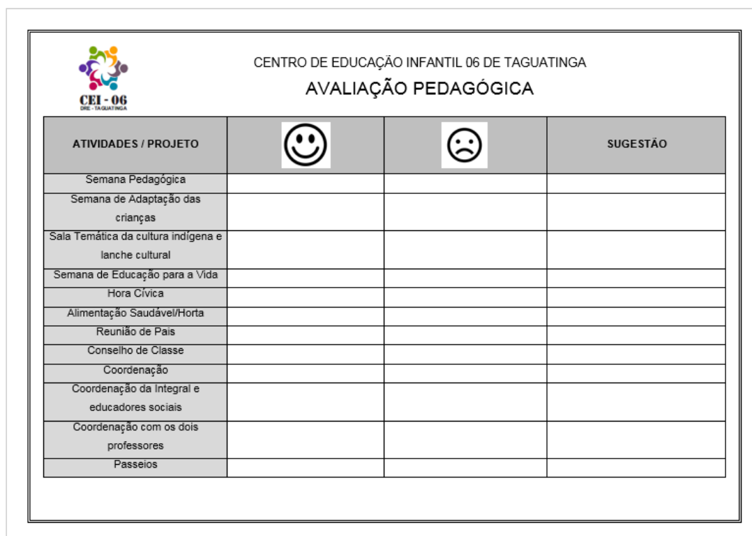
Questionário de avaliação pedagógica

A escola que passa por um processo avaliativo sério e participativo descobre sua identidade e acompanha a sua dinâmica. Muita coisa aprende-se com esse processo. Mas o que fica de mais importante é a vivência de uma caminhada reflexiva, democrática e formativa.