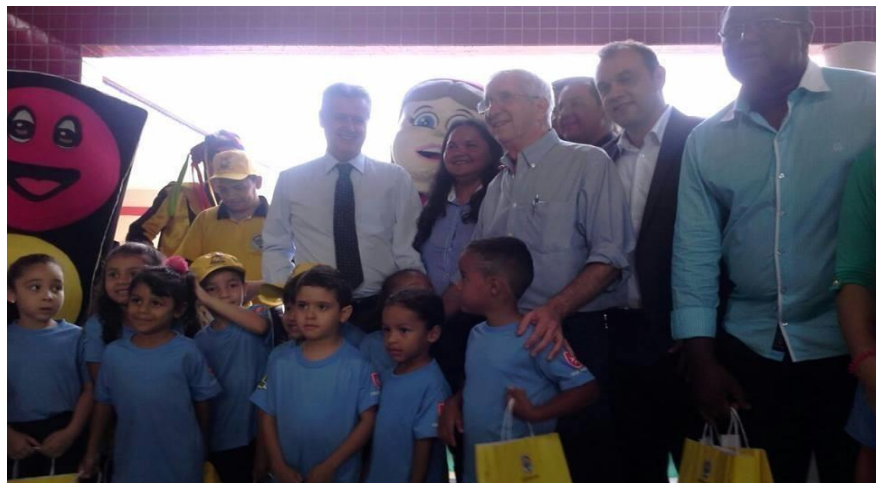
Figura 1-Governador de Brasília, Diretora do CEPI, Secretário de Educação, Administrador de Samambaia, Gerente da regional de ensino no ano de 2015.

O Centro de Educação da Primeira Infância – CEPI Pica-pau-branco está localizado na QN 307, Conjunto 08, Área especial 01, situado na Área urbana em Samambaia Sul, sob a administração da Associação Cruz de Malta, regido pelo convênio com o termo de Colaboração nº: 158/2017 Processo nº:080.008463/2017, com a vigência do termo de 5 anos.