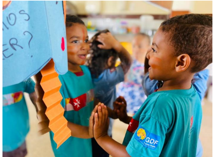
Figura 4 – Sala de atividades.

Temos também a brinquedoteca na sala multiuso onde as crianças utilizam para recreação, seguindo um cronograma de turmas. Quanto à estrutura física geral da Unidade de Educação, pode-se considerar que é bastante arejado, com espaço amplo que possibilita desenvolver atividades pedagógicas e recreativas, porém tem alguns pontos negativos, por exemplo, quando chove alaga o pátio interno coberto, dificultando as atividades fora de sala no período chuvoso, comprometendo as atividades recreativas.