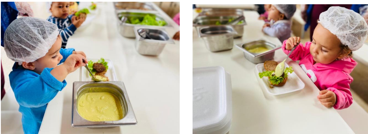
Figura 5 – Produção cozinha experimental com hortaliças da horta orgânica.

Considerar a Educação Infantil como primeira etapa da educação básica implica em questionar qual a educação que se almeja para a construção de uma sociedade mais democrática e solidária, bem como, até que ponto a educação que chega aos diversos segmentos sociais responde às exigências contemporâneas de aprendizagem e respeita o direito das crianças de se desenvolverem como seres humanos.