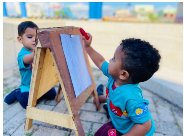
Figura 3 – Cantos diversificados.

A estrutura física geral o CEPI é bastante arejado, com espaços amplos que possibilitam desenvolver atividades pedagógicas e recreativas, segue na seguinte divisão: