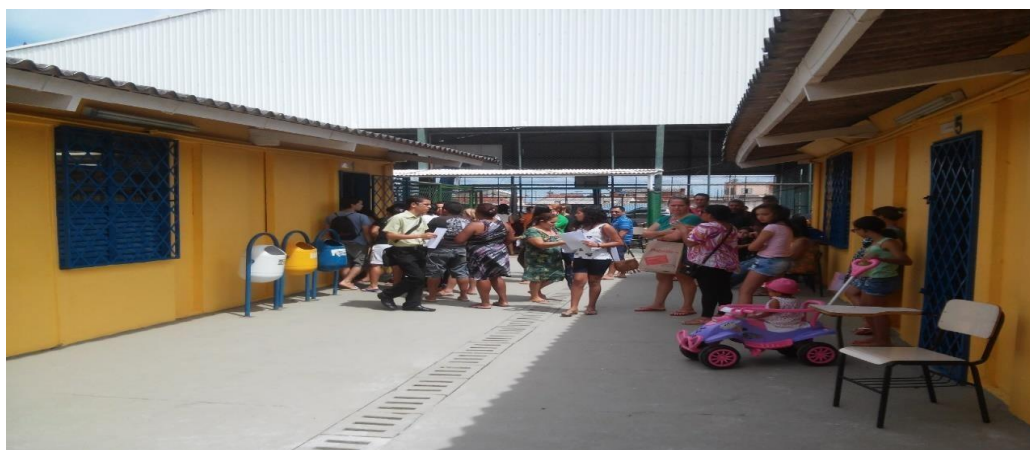
Expansão do CIL Recanto turno diurno – 2º sem. 2015 – CEF 306