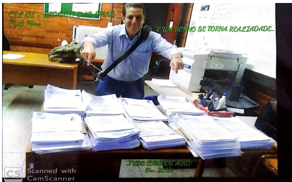
400 primeiras matrículas do CIL Recanto – 1º sem. 2015

“Em 2015, entretanto, de forma inédita na história dos CIL, novas unidades foram criadas por iniciativa da gestão central da SEEDF: CIL do Recanto das Emas, CIL de Planaltina e CIL de Santa Maria. Entretanto, tal decisão foi resultado de movimentos das comunidades das Regiões Administrativas que, havia muito tempo, pleiteavam a criação dessas UEs de línguas. No caso do Recanto das Emas, levou-se também em conta a existência de um projeto de CIL, existente há muitos anos, no Centro Educacional Myriam Ervilha, cujas atividades não foram encerradas mesmo depois da criação do CIL nessa Região Administrativa, dada a importância conquistada por esse projeto nessa comunidade muito carente.”