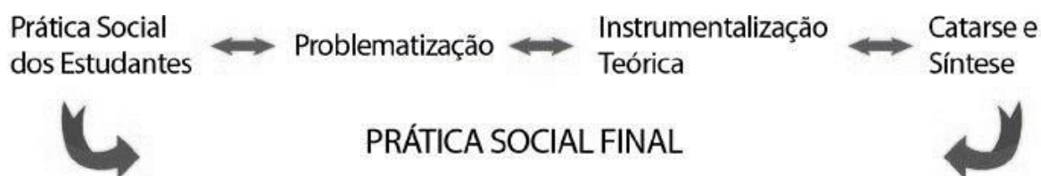
Figura 1 – Processo de construção de conhecimentos

professor com vistas ao alcance dos objetivos de aprendizagem. São indicados procedimentos e conteúdos a serem adotados e trabalhados por meio da aquisição, significação e recontextualização das diferentes linguagens expressas socialmente. A mediação docente resumindo, interpretando, indicando, selecionando os conteúdos numa experiência coletiva de colaboração produz a instrumentalização dos estudantes nas diferentes dimensões dos conceitos cotidianos e científicos que, por sua vez, possibilitará outra expressão da prática social (catarse e síntese). Tal processo de construção do conhecimento percorrerá caminhos que retornam de maneira dialética para a prática social (prática social final).